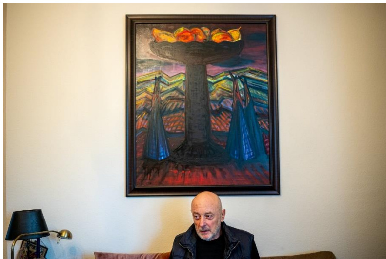
MOHOS MÁRTON / 24.HU

Ezzel ön is azt állítja, hogy Ukrajnában „proxy-háború” zajlik?