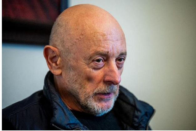
MOHOS MÁRTON / 24.HU

De hát nemcsak az oroszoké, a legtöbb ország véres történelme kiváló táptalaj az áldozati mentalitásnak, a tapasztalatok szerint mégis rettentően destruktív, amikor ez hivatalos ideológiává lép elő, mert csak újabb feloldhatatlan szembenállásokat generál. Másrészt szerintem nagyon is helyénvaló a gyarmatosítás és az erőltetett „demokráciaexport” katasztrofális következményeit a nyugati nagyhatalmak fejére olvasni, de azért a keleti autoriter rezsimek sem bizonyultak szégyenlősnek az erőszakos beavatkozás, a kizsákmányolás és a saját érdekeik érvényesítése terén. Ha viszont a jelenlegi ukrán helyzetről beszélünk, nem érzi veszélyes relativizálásnak, amikor elsikkad a háborús agresszor egyértelmű azonosítása, és egyből az ukránok vagy a Nyugat provokációjáról kezdenek beszélni?