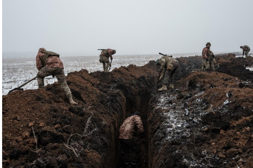
Ukrán katonák lövészárkot ásnek a donbaszi frontvonalon 2023. február 1-jén.