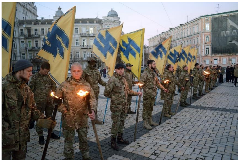
Az Azov-zászlóalj katonái az elesett társaikért tartott kijevi megemlékezésen 2022. november 13-án.

Természetesen orosz oldalon is megvannak ennek megfelelői a különféle orosz neonáci mozgalmakban, paramilitáris rohamosztagokban, a Wagner-csoport egyes alakulataiban, a kadirovista muszlim egységekben, és létezik ennek a háborús halált heroizáló fasiszta giccsnek az ideológiája is, legismertebb képviselője Alekszandr Dugin, aki Hazánk – a halál című írásában foglalta össze az orosz posztfasizmus halálkultuszát. A posztheroikus társadalmi mentalitással ezek az extremista félkatonai-katonai ifjúsági szervezetek szegezik szembe a „veszélyes élet”, a „halálban felmagasztosuló élet” fasiszta giccset. A hősiesség fasiszta imitációjának imitációját. Ugyanakkor látnunk kell, hogy a haláligenlés fasiszta heroizmusával a posztheroikus, posztnemzeti fogyasztói élménytársadalmak nemigen tudnak mit szembeállítani.