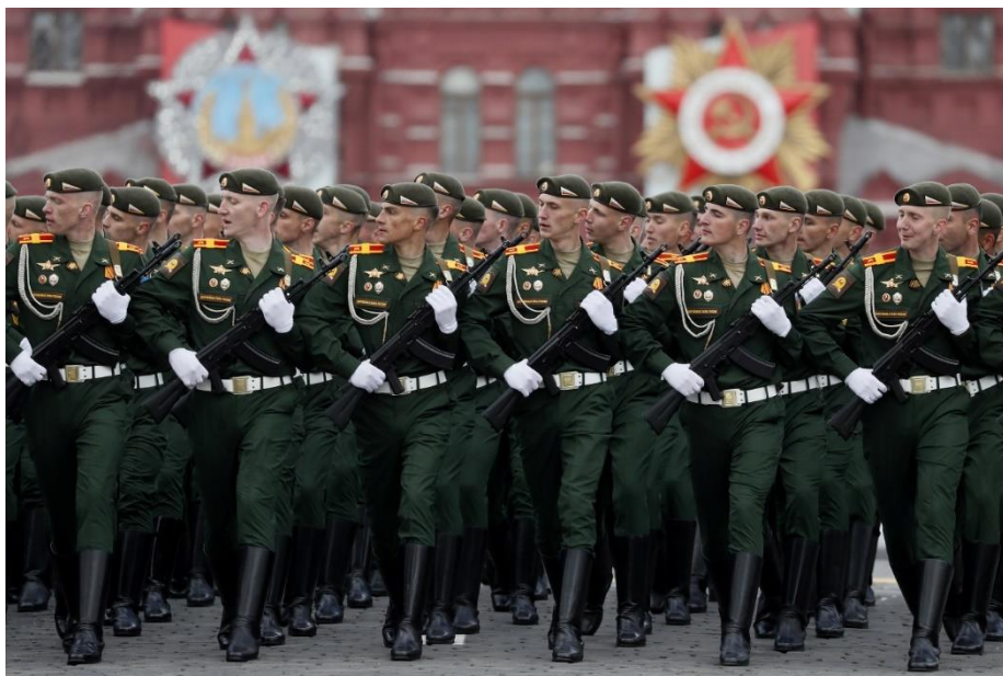
Orosz katonák felvonulása a győzelem napi díszszemlén a moszkvai Vörös téren 2022. május 9-én.

Még mindig nem veszítette érvényét, amit V. Mehmed, az Oszmán Birodalom utolsó szultánja – az ő nevét viselte pár évig az első világháborúban a Múzeum körút – egy tárgyalás alkalmával mondott, amikor leintett egy brit diplomatát: Oroszországot levérni? De hisz a holtteteme agyonnyomna minket!